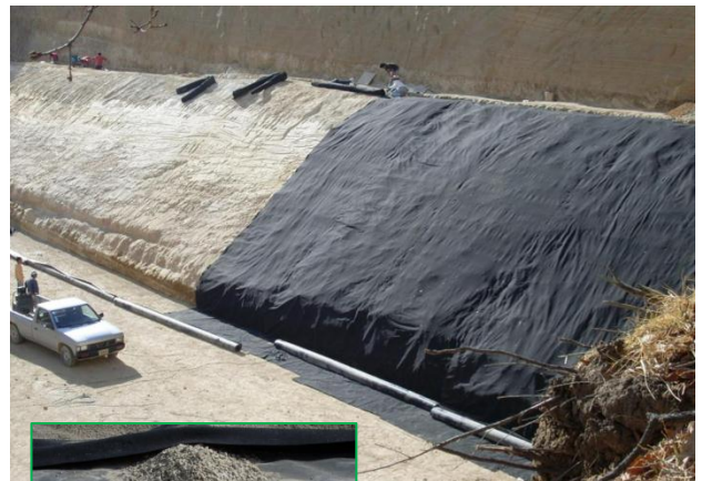
Celda de Confinamiento Final y su Dren, construida para Bio-sistemas Sustentables, en Villa Nicolás Romero, Estado de México.

Solicite la asesoría gratuita de nuestros asesores técnicos.